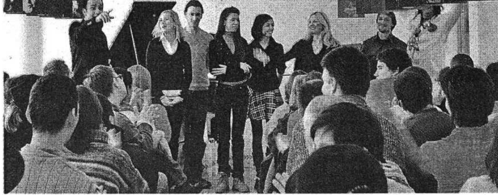
Публика и уметници на концерту